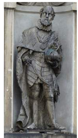
Św. Ferdynand Kastylijski

Na podstawie przeprowadzonych badań warstw malarskich ustalono, że górne, pokryte blachą, rzeźby dość wcześnie, a może i oryginalnie, mogły zostać pokryte białawą lub miejscami żółtawą warstwą malarską. Na całej powierzchni dolnych figur również występuje warstwa malarska, ale mogła ona zostać nałożona nieco później.