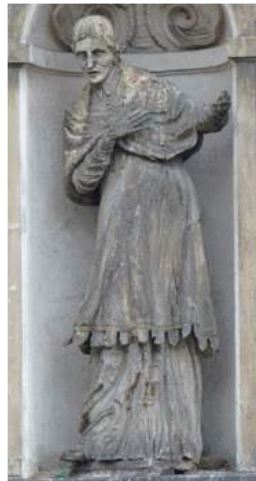
Św. Karol Boromeusz