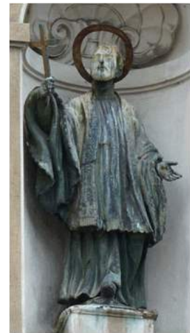
Św. Franciszek Ksawery