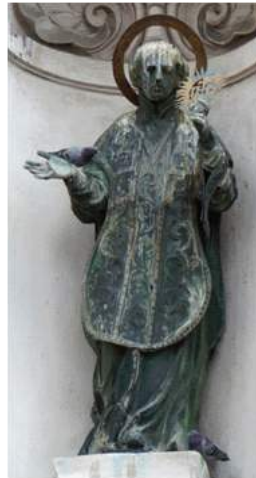
Św. Ignacy Loyola

Do badań zostały ze wszystkich rzeźb pobrane liczne próbki drewna, blach i gwoździ, warstw malarskich oraz zapraw.